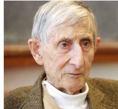
Freeman John DYSON: "Es una locura intentar reducir el CO 2 "

"El CO 2 es tan beneficioso en otros sentidos que sería una locura intentar reducirlo", afirmó Dyson. ▀